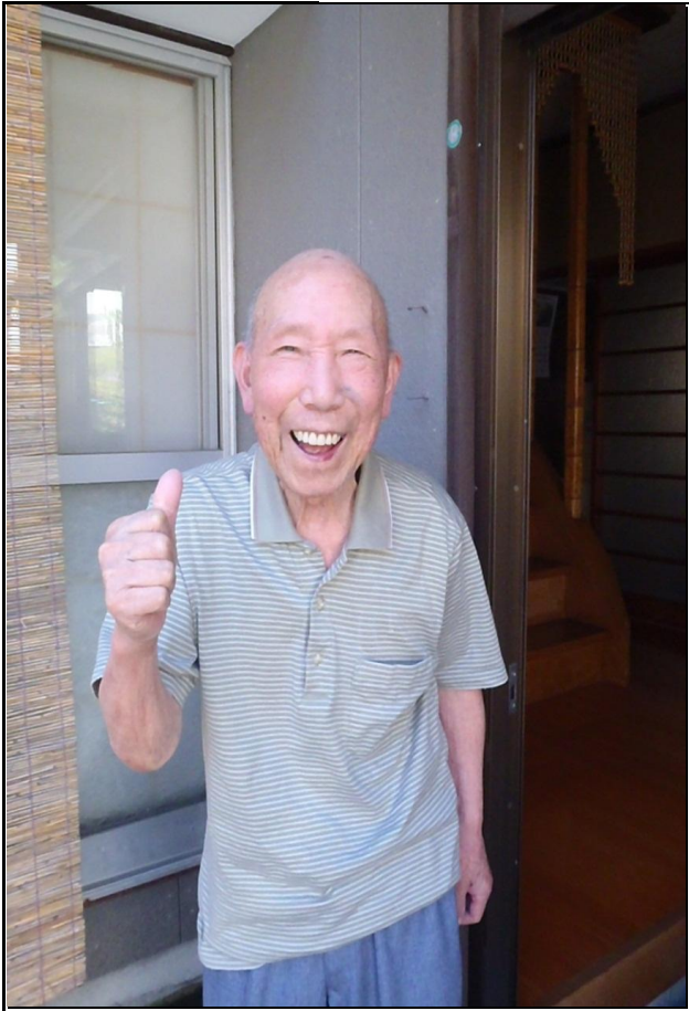
自宅にて、調子はいかがですかとお聞きすると、親指を立てて“グー”。笑顔がまぶしいくらいですね!