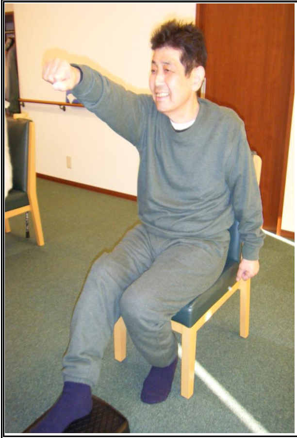
ステップ台を使って、「無理なく、楽しく」運動できます。